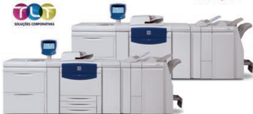
XEROX DIGITAL COLOR PRESS X700

DIRETO DA DRUPA 2012 IMPRESSÃO DIGITAL COM VERNIZ LOCALIZADO