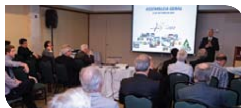
Reunião da diretoria da ABTCP