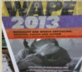
Cartaz Wape 2013