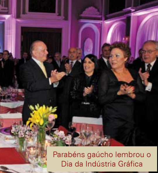
Parabéns gaúcho lembrou o Dia da Indústria Gráfica